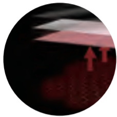
Tissu thermique 3 en 1 imperméable